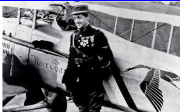
Hommage à Georges Guynemer, qui disparaît aux commandes de son avion le 11 septembre 1917

http://www.union-ihedn.org/les-actualites/revue-de-presse/