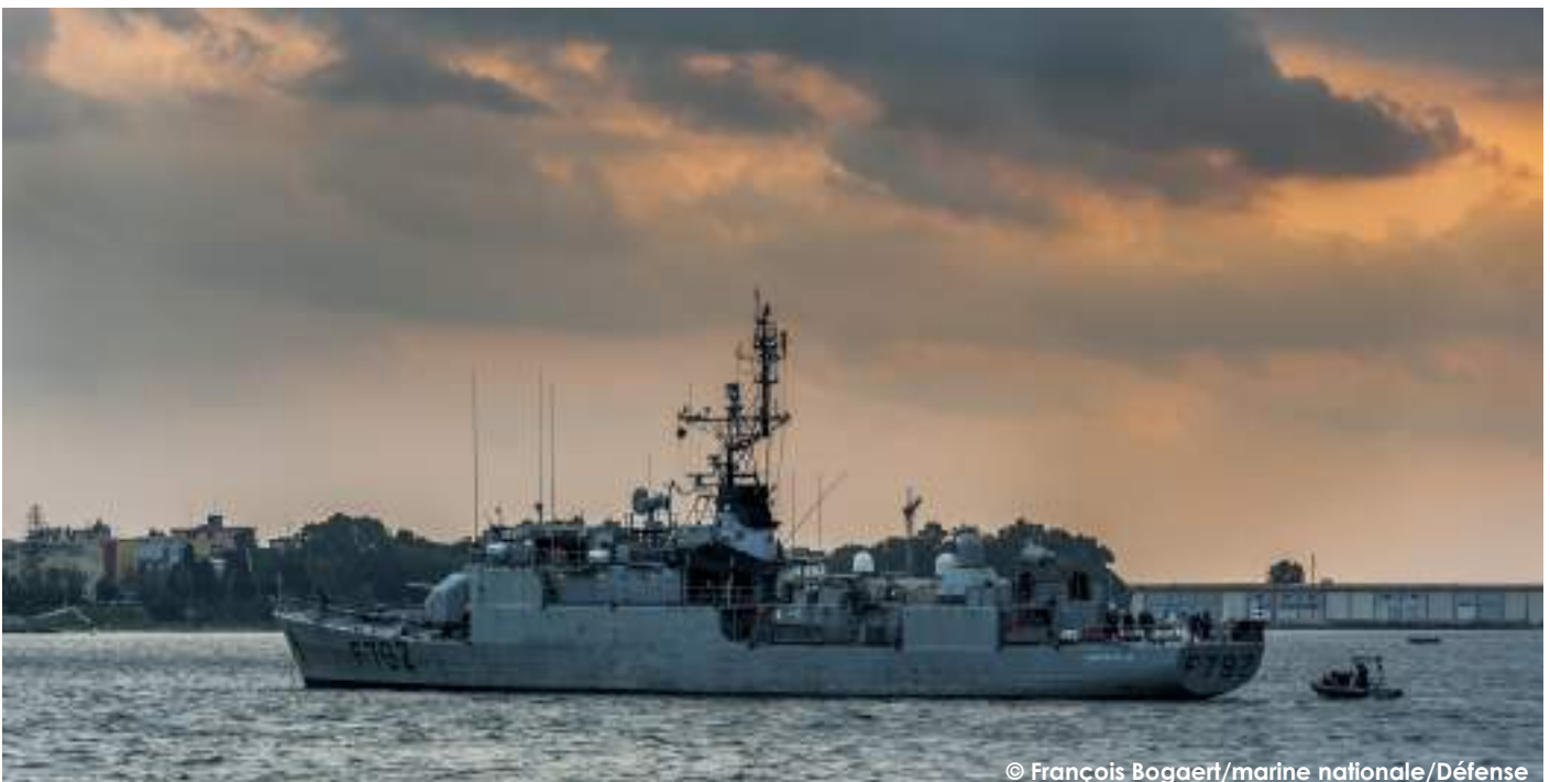
L'avis le Premier-maître l'Her

Parce qu'il s'agit d'un bâtiment ancien, le Premier-maître l'Her offre un contrepoint avec l'ultra-moderne SNLE et donne l'opportunité aux membres de la CAJ d'avoir un riche aperçu de la marine.