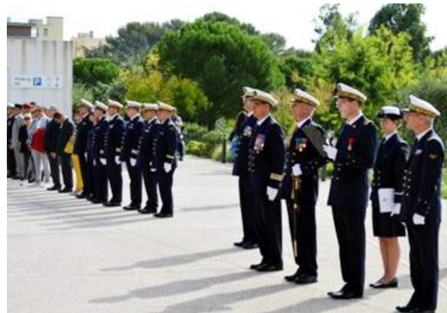
A l'hôpital d'instruction des armées ( HIA ) Saint-Anne s'est tenue une cérémonie militaire en l'honneur de la Saint-Luc avec un hommage aux blessés du SSA et à leur famille.