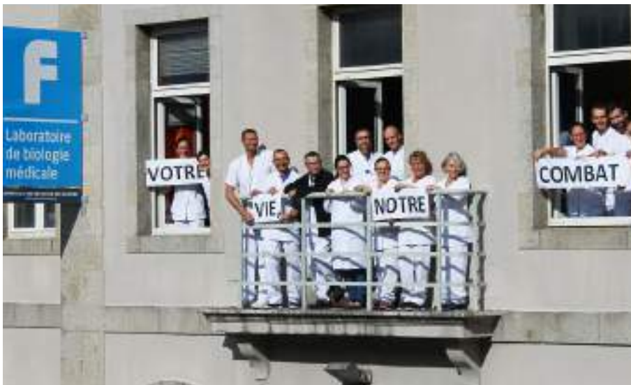
L'hôpital d'instruction des armées Clermont-Tonnerre a organisé un concours photos. Le jury composé de personnels blessés a effectué une remise de prix et a récompensé la meilleure photo.