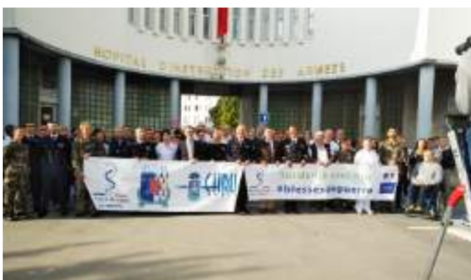
L' HIA Clermont-Tonnerre , le 16 e centre médical des armées (CMA) et le centre hospitalier régional universitaire (CHRU) de Brest tous réunis pour les blessés.