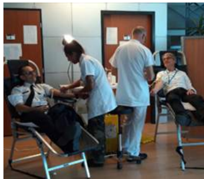
Don du sang organisé à l' IRBA par le centre de transfusion sanguine des armées (CTSA).