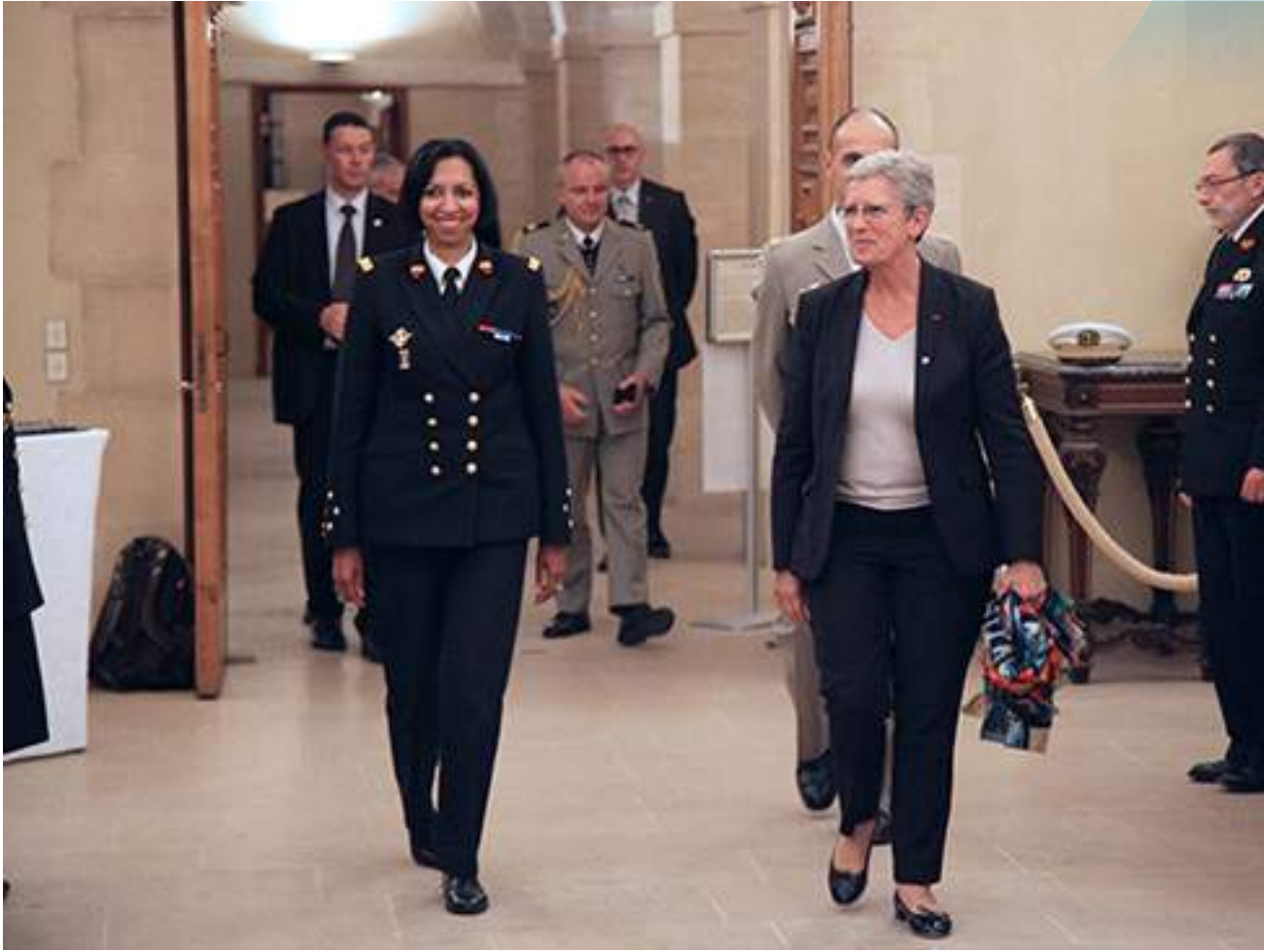
Inauguration du concert à la chapelle du Val-de-Grâce