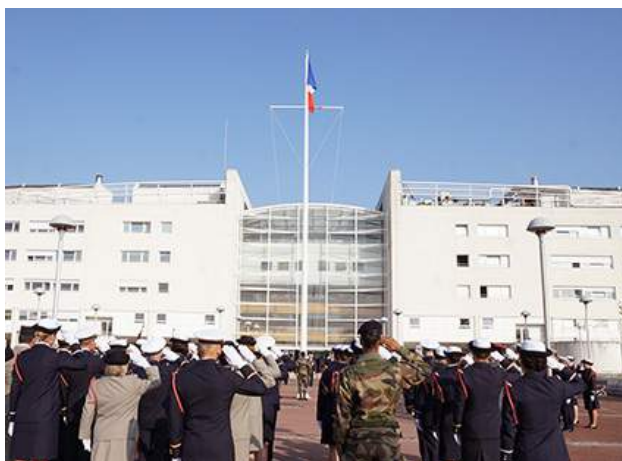
Cérémonie des Couleurs sur la place d'armes de l'hôpital d'instruction des armées (HIA) PERCY.