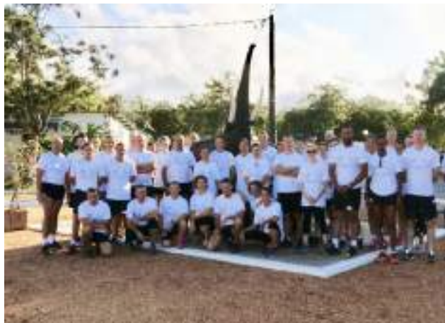
La direction interarmées du service de santé des armées ( DIASS ) pour l'Afrique centrale et de l'ouest arbore fièrement le tee-shirt commémoratif avant une course à pied autour du camp.