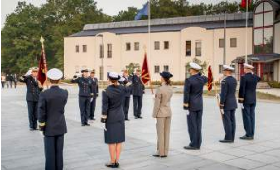
Cérémonie militaire à la Direction des Approvisionnements en Produits de Santé des Armées ( DAPSA ).

PRISE D'ARMES DE LA DIRECTION CENTRALE p.2