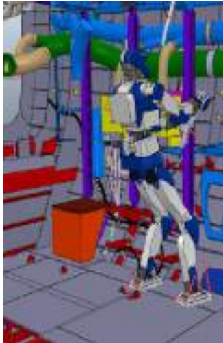
Fig.6 : Simulation of a multi-contact task by a humanoid for airplane assembly.

heavy ethical procedure, a humanoid robot can evaluate the effect of wearable assistive devices in a quantitative manner. In this process, humanoids also wear these assistive devices and reproduce human motions (Fig. 7).