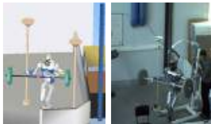
Fig. 1: Application of motion planning for to a humanoid robot HRP-2 carrying a bulky object in a cluttered environment avoiding obstacles.

noid robot research platforms exist, like Atlas (Boston Dynamics), Hubo (KAIST), REEM (PAL Robotics) or TORO (DLR), HRP-2 was the only platform commercially available with technical support in 2005.