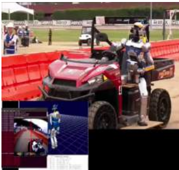
Fig. 4: Humanoid HRP-2 driving a utility vehicle operated by the French-Japanese team in DARPA robotics challenge.