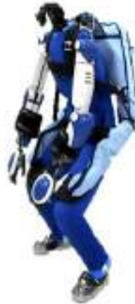
Fig.7 : Humanoid robot HRP-4 testing a wearable assistive device as a "subject" for a quantitative assessment.

This research is conducted within the framework of the Robotic Nursing Care Device Project, supported by private companies that develop various assistive devices.