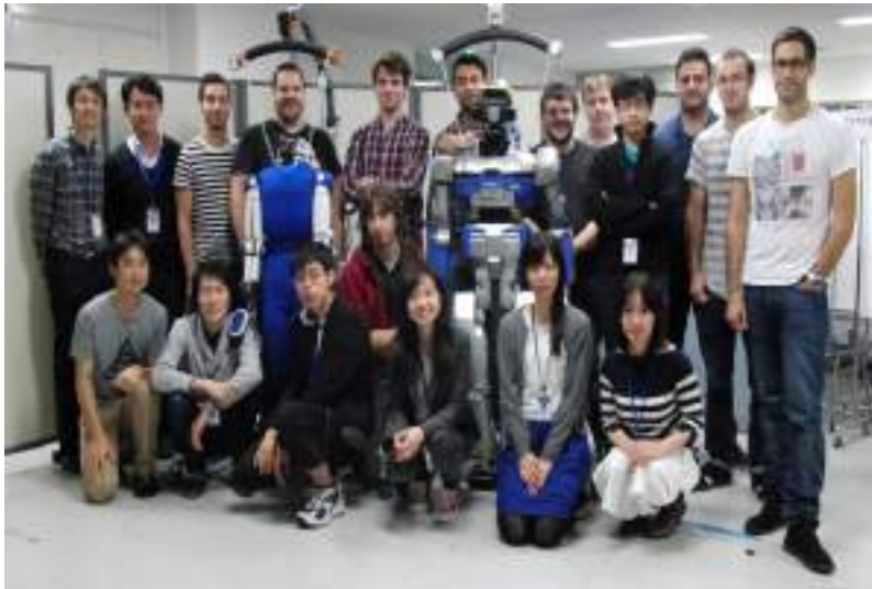
Fig. 5: The international JRL team.