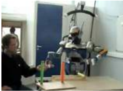
Fig. 2: Human-robot cooperative task using high-level language programming.

research with LMS in Lyon, where language-based high-level programming techniques were connected to the HRP-2 to develop human-humanoid interactions (Fig. 2). Beginning research on humanoid robotics also brought new initiatives within the LAAS-CNRS, notably the emergence of the new “Geppetto” group, led by Dr. Laumond. This group was created to push human and humanoid research activities forward. Starting with only a few people, it grew into a leading team with more than 30 members, developing scientific publications and numerous projects.