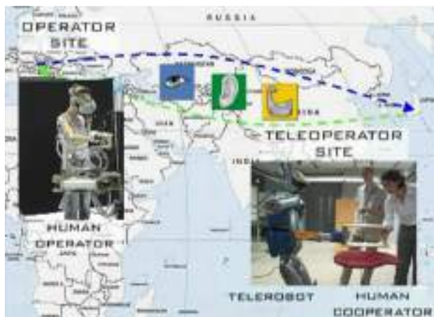
Fig. 3: Intercontinental teleoperation of a humanoid robot executing a collaborative object-carrying with a human.

Cooperative Program on “Information and Communications Technology (ICT) including Computer Science”. This project helped to equalize researcher exchanges, notably by sending Japanese researchers to France.